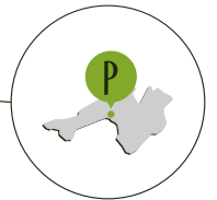
PROSECCO DOCG ZONE